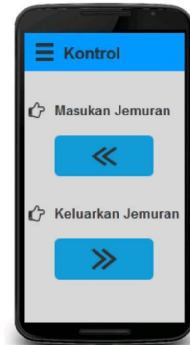
Gambar 3. Halaman kontrol.

Sedangkan pada halaman kontrol adalah halaman yang berguna untuk menggerakkan jemuran. Terdapat 2 buah motor yang ditanamkan pada sistem. Diantaranya yaitu masukkan jemuran kearah kiri dan keluarkan jemuran kearah kanan. Adapun tampilan halaman kontrol dapat dilihat pada Gambar 3.