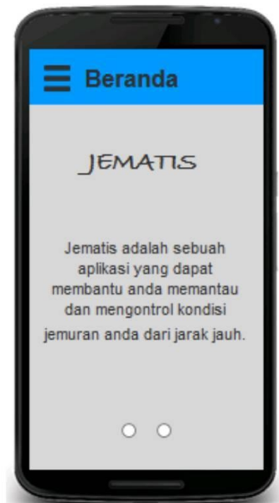
Gambar 1. Halaman beranda.

Pengujian ini bertujuan untuk melihat apakah sistem User Interface benar – benar bekerja dengan baik atau tidak. User Interface tersebut dibuat dengan nama JEMATIS. Dalam aplikasi tersebut dibuat 4 halaman yaitu halaman beranda, halaman status, halaman kontrol dan halaman pengaturan. Tampilan halaman beranda tersebut ditunjukkan pada Gambar 1.