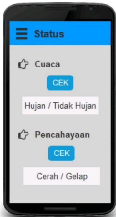
Gambar 2. Halaman status.

Pada halaman Gambar 2 secara realtime dapat menampilkan hasil pembacaan masing-masing sensor. Hasilnya dapat berubah-ubah sesuai dengan hasil pembacaan sensor. Data hasil pembacaan sensor secara realtime dikirim ke server, kemudian disimpan kedalam database, setelah itu kemudian ditampilkan pada halaman monitoring . Data secara realtime dikirim setiap 5 menit.