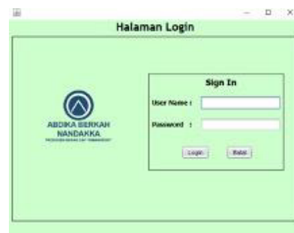
Gambar 3. Halaman Login

Diagram Konteks yang diusulkan untuk sistem informasi penjualan berbasis desktop. Gambar 2. menunjukkan diagram konteks untuk sistem informasi penjualan berbasis desktop. Ini memberikan gambaran umum tentang sistem dan interaksinya dengan entitas eksternal. Diagram konteks menampilkan komponen utama sistem informasi penjualan dan interaksinya dengan entitas eksternal [10]. Entitas eksternal ini dapat mencakup pelanggan, pemasok, dan sistem atau database lain yang perlu berinteraksi dengan sistem informasi penjualan. Diagram konteks memberikan representasi visual tentang bagaimana sistem informasi penjualan berfungsi dalam lingkungannya. Ini membantu untuk mengidentifikasi batas-batas sistem dan memahami aliran data antara entitas yang berbeda.