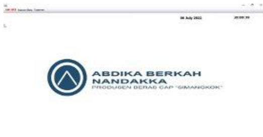
Gambar 4. Tampilan Layar Menu Utama

ukuran keamanan untuk memastikan bahwa hanya individu yang berwenang yang dapat mengakses sistem. Layar Login mengharuskan pengguna untuk memasukkan nama pengguna dan kata sandi unik mereka untuk mendapatkan akses. Setelah masuk, pengguna dapat mengakses semua fitur dan fungsionalitas sistem informasi penjualan. Ini termasuk fitur seperti melihat dan mengelola inventaris, memproses transaksi penjualan, membuat laporan, dan memperbarui tingkat stok.